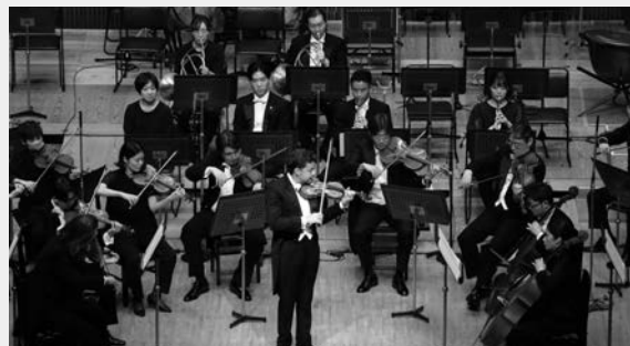
第321回定期演奏会 指揮&ヴァイオリン/ヴィオラ：ジュリアン・ラクリン

ウィーンの名匠 ラクリンを招聘し、指揮、ヴァイオリン&ヴィオラの弾き振りで観客を魅了した本公演。“圧倒的な音楽的な説得力”と評され、まさに山響が長期的土台としているテーマ“Soloistic”の極みであり、世界のトップランナーが集った2024シーズンを象徴する公演となった。