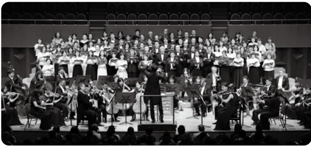
さくらんぼコンサート2024 大阪公演 さくらんぼコンサート初登場となった山響アマテウスコアが、地元大阪の合唱団とともに歌い上げた《戴冠式ミサ》