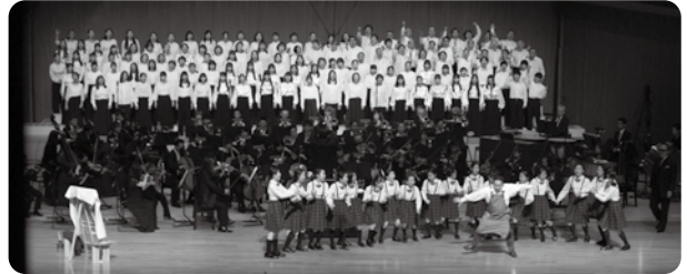
やまぎん県民ホールシリーズ 演奏会形式オペラシリーズⅢ《トスカ》 3回目の開催となった阪&山響による演奏会形式オペラシリーズ。地元の児童や学生合唱団を起用し、街全体でオペラ文化を発信している。

【県内35市町村サックス・プロジェクト 推進】 創立50周年を機に、県内35市町村でのアンサンブルコンサートと“食”“観光”と連携した映像を制作・配信を行っている。これにより舞台芸術を享受する地域間格差を埋める。