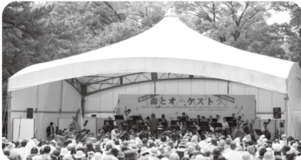
第45回森とオーケストラ(群馬交響楽団野外コンサート) 指揮：飯森範親(群馬常任指揮者) (2024年4月29日 群馬の森特設ステージ) 飯森常任指揮者による群響恒例の野外コンサート。開放的な雰囲気の中、約7,000人の群馬県民の前に演奏を披露した。