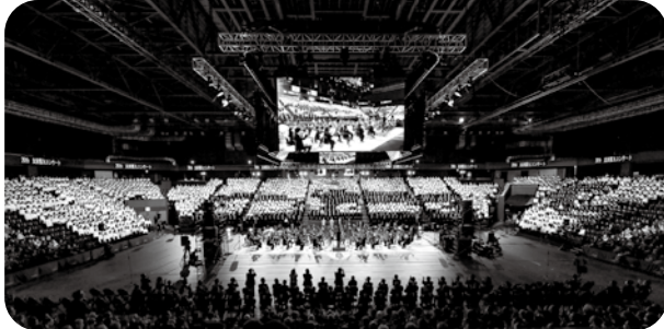
太田市20周年記念式典&群馬交響楽団と20周年記念合唱団「第九コンサート」 指揮：藤岡幸夫 ソプラノ：野々村彩乃 メゾ・ソプラノ：富岡明子 テノール：西村信 バリトン：宮本益光 (2025年3月9日 OPEN HOUSE ARENA OTA) 群馬県太田市20周年を記念した公演として、5,000人収容のアリーナで約2,200名の合唱団と共に祝祭的な雰囲気で公演を行った。