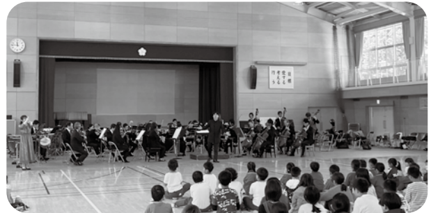
移動音楽教室 (2024年5月9日 下仁田中学校体育館) 群響創立間もない1947年にスタートし、現在までに650万人を超える群馬県内小中学校の児童・生徒がオーケストラを体験している。