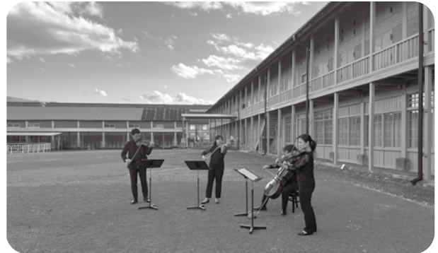
県内観光地とのタイアップ動画製作(富岡市世界遺産編) (2024年11月18日 富岡製糸場) 群響×観光をテーマにこれまでに草津、伊香保、みなかみで演奏動画を製作。世界遺産10周年に合わせ「富岡製糸場と絹産業遺産群」を製作した。動画はYoutubeチャンネルの他、各地の施設や観光案内所等で上映されている。