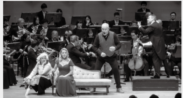
R.シュトラウス コンサートオペラシリーズ第3弾 《ばらの騎士》 指揮=ジョナサン・ノット 2024年12月13日 サントリーホール

音楽監督ジョナサン・ノットとのR.シュトラウス コンサートオペラシリーズのフィナーレ。チケットは完売。歌手陣も海外からはベテランから気鋭の若手を揃え、日本人歌手陣も日本を代表するメンバーを揃えた。演奏内容も各メディアで高く評価され、SNSにおいても「#ばらの騎士」がトレンドワードに上がるほど大きな話題となり、シリーズ最終章を締めくくった。