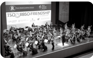
RBSO & TSO フレンドシップコンサート 《アジア・プロジェクト》 指揮=原田慶太楼 2024年7月30日 キングスカレッジ・インターナショナル・ スクール グレイトホール(バンコク)