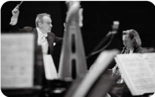
第726回 定期演奏会 指揮=ジョナサン・ノット 2024年11月9日 サントリーホール