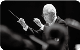
第724回 定期演奏会 《秋山和慶指揮者生活60周年記念》 指揮=秋山和慶 2024年9月21日 サントリーホール