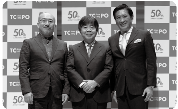
創立50周年 & 2025-2026 シーズンラインナップ記者会見 (2024年11月18日 東京オペラシティ コンサートホール)

●アウトリーチコンサート 普段劇場になかなか足を運べない子どもたちのために本物の芸術に触れる機会を提供する出前コンサートです。東京シティ・フィルが主な拠点としているティアラこうとうが主催し、江東区芸術提携団体である東京シティ・パレエ団と共に江東区内の小学校を訪問し、参加型の体験プログラムを実施しています。