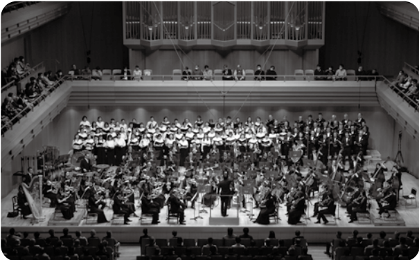
第376回定期演奏会 伊福部昭：交響頌偈(祝迦) 指揮：藤岡幸夫 (2024年2月14日 東京オペラシティ コンサートホール)