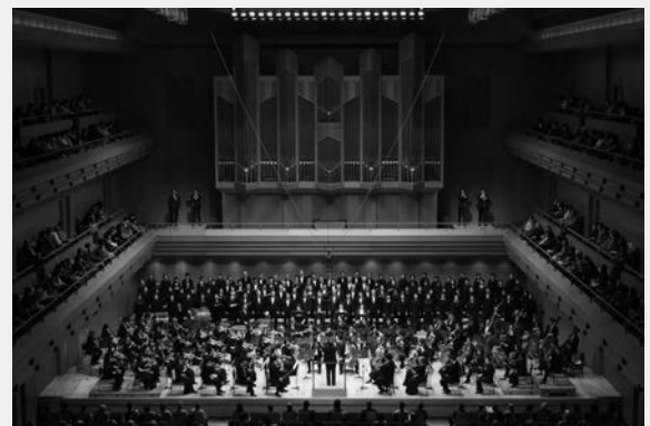
第377回定期演奏会 ヴェルディ：レクイエム 指揮：高関健 (2024年3月8日 東京オペラシティ コンサートホール) ※コロナ禍でプログラム変更を余儀なくされた公演を実現。