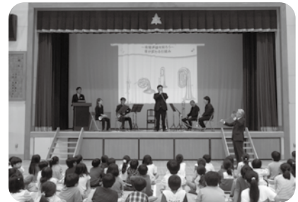
芸術提携を結んでいる江東区で実施している「ティアラこうとうアウトリーチ」の様子。