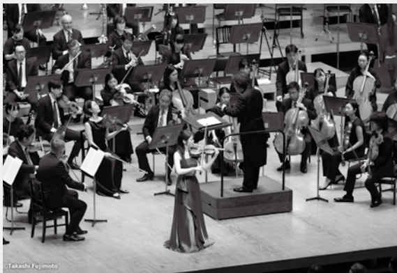
第164回定期演奏会 指揮:飯森範親 ヴァイオリン:高木凜々子

ラヴェル、サン＝サーンス、ドビュシーの不朽の作品からフランス音楽の神髄に迫った