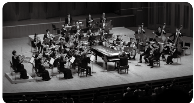
第168回定期演奏会 指揮・ピアノ:横山幸雄 横山幸雄の弾き振りによる、ベートーヴェン・ツィクルス第1弾