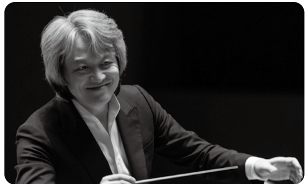
指揮者／クリエイティブ・パートナー 鈴木優人