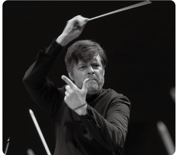
首席客演指揮者 ユライ・ヴァルチュハ

社会貢献活動として、公益財団法人「正力厚生会」のがん患者助成事業に協力する「ハートフル・コンサート」、小中学校での「フレンドシップ・コンサート」、中規模ホールにアンサンブルを届ける地域密着型の「サロン・コンサート」等を行っている。 また、東京芸術劇場との提携事業として、楽団員がアンサンブル演奏の指導を行う「芸劇ジュニア・アンサンブル・アカデミー」等の教育支援活動も行っている。