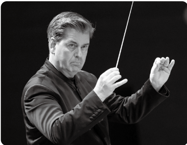
《第632回定期演奏会》アイスラー：ドイツ交響曲 作品50(日本初演) 指揮：セバスティアン・ヴァイグレ (2023年10月17日 サントリーホール)