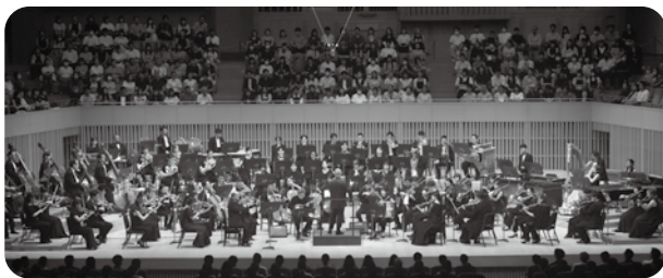
京都特別演奏会 2024年8月10日(土) 京都コンサートホール 大ホール 指揮：久石譲 久石譲次期音楽監督(2025年4月〜)と美しいヨーロッパの風を感じさせる爽やかなコンサート。翌日は山口県防府市へと巡回。両公演とも満席のお客様を迎えられた。