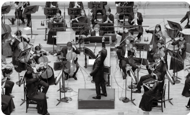
ハイドンマラソン HM.38 〈ファイナル〉 2025年3月21日(金) ザ・シンフォニーホール 指揮：飯森範親 合唱：日本センチュリー合唱団 飯森マエストロと10年にわたった大プロジェクトのフィナーレ。最後は〈ロンドン〉で感動的かつ清々しい大団円を迎えた。