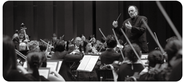
第425回定期演奏会 〈首の魔術師、巨匠シャルル・デュトワ初登場!〉 指揮:シャルル・デュトワ ヴァイオリン:辻彰奈