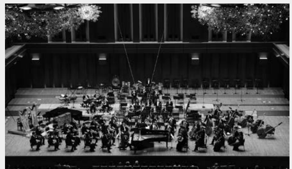
第420回定期演奏会〈太田弦首席指揮者就任記念〉 指揮: 太田弦 ピアノ: 亀井聖矢 ショスタコーヴィチ/祝典序曲 ショパン/ピアノ協奏曲 第1番 小短調 ショスタコーヴィチ/交響曲 第5番

2024年4月11日(木)、12日(金) アクロス福岡シンフォニーホール 長年に渡り首席指揮者、音楽監督を務めた小泉和裕からバトンを受け継いだ太田弦の首席指揮者としてのお披露目のコンサート。2日間に渡りほぼ満席となったアクロス福岡の客席に「新しい九響」の音を印象付けた。開演前のプレトークでは、にこやかな笑顔と優しい語り口が新鮮で、これからの九響はこの「若きマエストロ」と成長していくのだらうという未来を見ることができた。