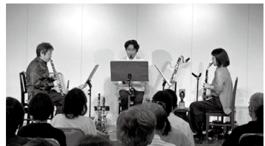
室内楽の機会も多く、多くの県民に支持されているコンサートの1つである。