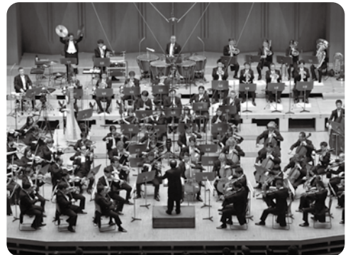
N響ドラゴンクエスト・コンサート ～そして伝説へ…～ すぎやまこういち:《交響組曲「ドラゴンクエストⅢ」そして伝説へ…》 (1987年N響録音版・全曲) 指揮：下野竜也 (2024年5月6日 東京芸術劇場)