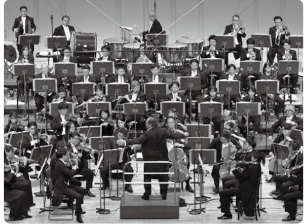
第2028回 定期公演 1月Aプログラム — ショスタコーヴィチ没後50年 — ショスタコーヴィチ《交響曲第7番「レニングラード」》 指揮：トゥガン・ソヒエフ (2025年1月18日 NHKホール)

2003年にプロのオーケストラ楽員を育成する目的で開設されました。これまで多くの人材をN響のみならず、全国のオーケストラに輩出しています。