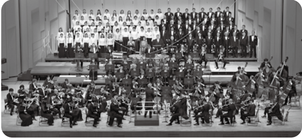
ベートーヴェン「第9」演奏会 ベートーヴェン《交響曲第9番「合唱つき」》 指揮：ファビオ・ルイーダ ソプラノ：ヘンリエッテ・ボンデ・ハンセン メゾ・ソプラノ：藤村実穂子 テノール：ステュアート・スケルトン バス・バリトン：トマス・トマソン 合唱：新国立劇場合唱団 (2024年12月18日 NHKホール)