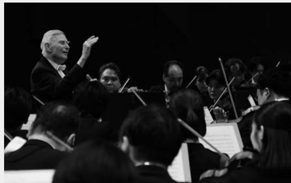
★第2021回 定期公演 10月Cプログラム シューベルト《交響曲第8番「ザ・グレート」》 指揮：ヘルベルト・ブロムシュテット (2024年10月25日 NHKホール)