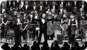
CCC presents 井上道義 ザ・ファイナル PART II みちよし先生の世界漫遊記 指揮：井上道義 2024年6月15日 すみだトリフォニーホール