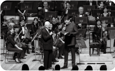
小澤征爾追悼演奏会 指揮：佐渡裕、秋山和慶、 C.アルミンク、チェロ：堤剛 2024年8月31日 すみだトリフォニーホール