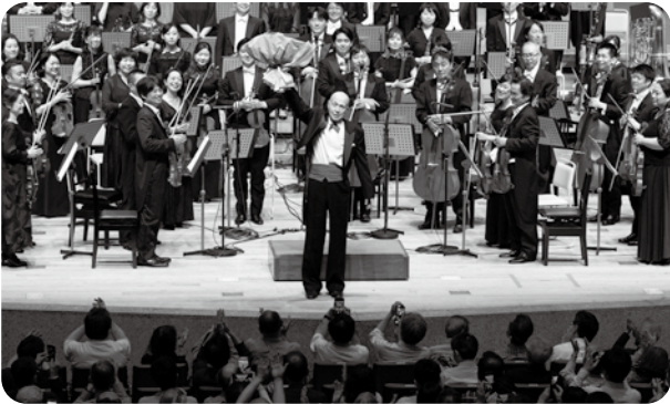
第999回定期演奏会 Aシリーズ 指揮/井上道義