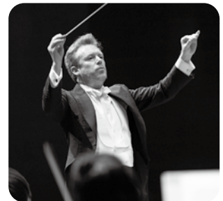
第1006回 定期演奏会 Bシリーズ 指揮/ダニエル・ハーディング