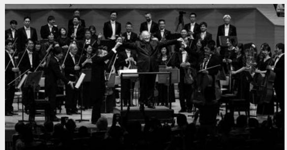
第1000回定期演奏会 Bシリーズ 2024年6月4日 サントリーホール 指揮/エリアフ・インバル ブルックナー:交響曲第9番 二短調 WAB109 (2021-22年 SPCM版*第4楽章付き) [*日本初演]

ブルックナー生誕200年と楽団の第1000回定期演奏会を記念して、最新版である2021-22年 SPCM版フィナーレを加えた4楽章版の交響曲第9番を演奏しました。ブルックナー指揮者としても人気を誇るインバル指揮による貴重かつ意欲的な試みで、多くの音楽愛好者の関心を集め、大きな反響を得ました。