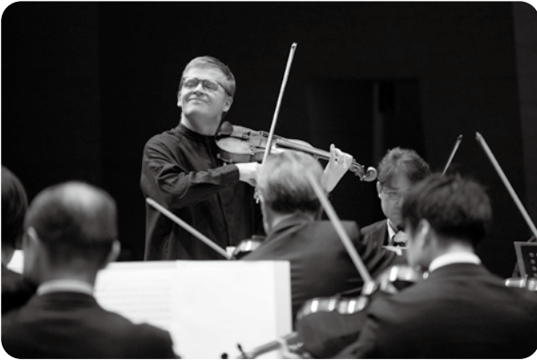
プロムナードコンサート No.407 指揮・ヴァイオリン/ペッカ・クーシスト