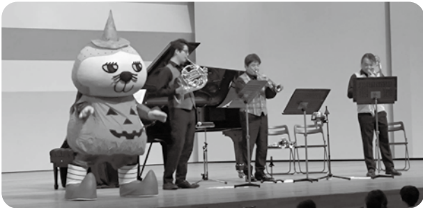
第2回わんぱくキッズのクラシック探検隊 2024年10月14日 伊賀市文化会館 さまざまホール