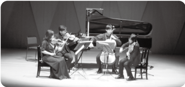
「音楽のあるひととき」Vol.16 クラシック音楽に出会う春 2024年4月30日 堺市民芸術文化ホール フェニーチェ堺 小ホール