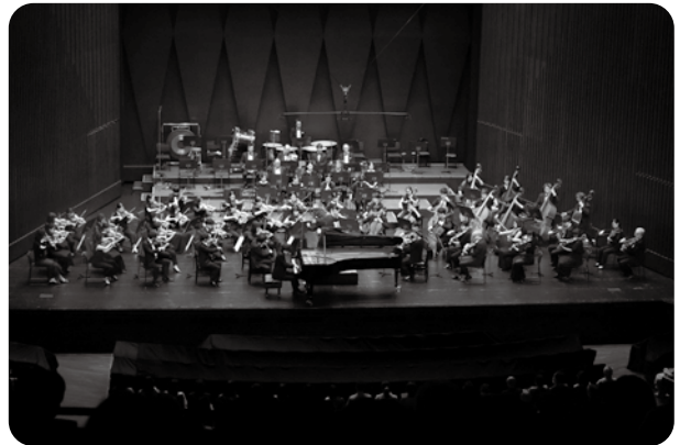
フェニーチェ堺 名曲シリーズ Vol.2 指揮: 山下一史(常任指揮者) ピアノ: 牛田智大 2024年6月15日 堺市民芸術文化ホール フェニーチェ堺 大ホール

2023年3月には、三重県伊賀市と公益財団法人伊賀市文化都市協会と「文化のまちづくり」推進に関する連携協定を締結。伊賀市での「クラシックのいろは」シリーズは毎年開催。また、乳幼児や小学生対象の音楽事業や小中学校でのワークショップも行っています。