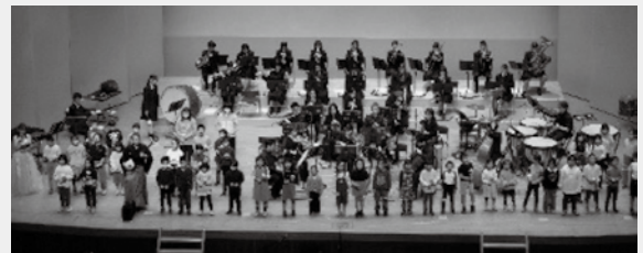
2024年11月30日(土) 宮崎県小林市コンサート 地元市民との共演